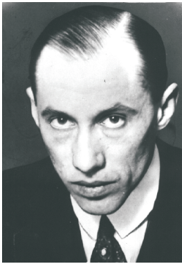
BOGUSŁAW MIEDZIŃSKI (1891–1972)