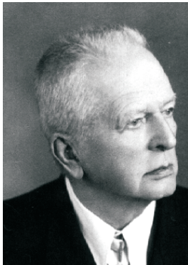
JULIAN JULIUSZ SZYMAŃSKI (1870–1958)

Umarł w 1953 r. w Poznaniu w wieku 93 lat. Pochowany został na poznańskim Cmentarzu Zasłużonych.