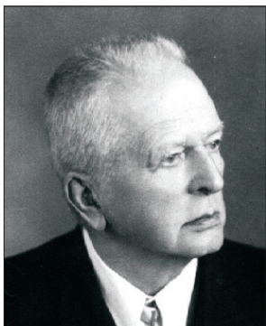
ЮЛИАН ЮЛИУШ ШИМАНЬСКИ (1870–1958)