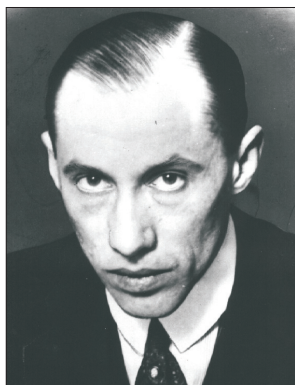
БОГУСЛАВ МЕДЗИНСЬКИ (1891–1972)