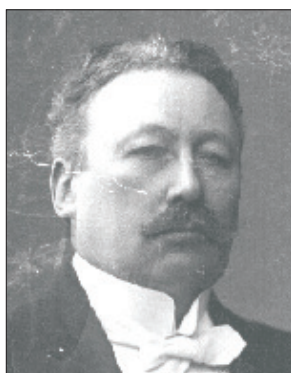
ВОЙЦЕХ ТРОМПЧИНСКИ (1860–1953)

На протяжении 17 лет существования Сената II Речи Посполитой (1922–1939) его работой руководили пять маршалов, которых объединяли привитые семьей национально-освободительные традиции поколения, выросшего после восстания 1863 г. Все они получили образование в высших учебных заведениях стран, аннексировавших Польшу, то есть в Австро-Венгрии, Германии и России. Во взрослую жизнь вступали на рубеже XIX и XX веков (1880–1914). В 1918 году, когда Польша вновь приобрела независимость, пятеро будущих маршалов Сената состояли в общественных и патриотических организациях в Польше и за границей. Прежде чем они попали на Вейскую улицу, где находится Сенат, занимали различные государственные посты во II Речи Посполитой. Всю свою жизнь интересовались политикой и польскими делами.