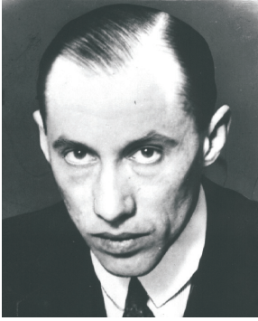
BOGUSŁAW MIEDZIŃSKI (1891–1972)

Senat der fünften Amtsperiode (1938–1939)