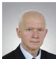
Sławomir Sadowski (PiS)