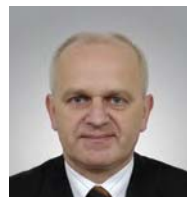
Władysław Dajczak (PiS)