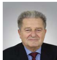
Ryszard Bender (PiS)