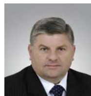
Tadeusz Skorupa (PiS)