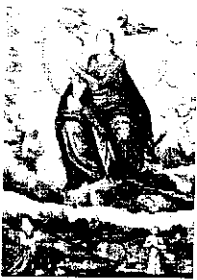
Matko Łaskawa Zwyciężyłaś